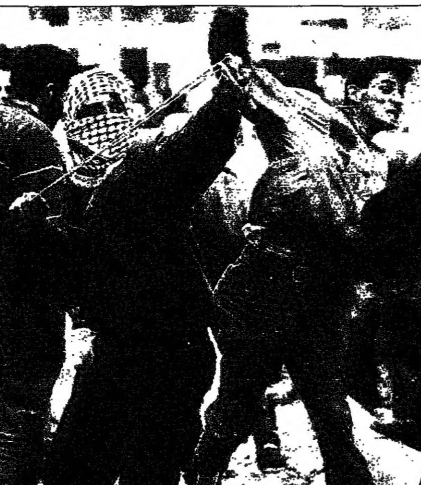
شباب فلسطينيان اندمما يرددان النشيد الوطني في مدينة الخليل (اس (رويترز)

القدس - من كولين سيفيل: قالت اسرئيل أمس ان السلطة الفلسطينية تشتد طرد الفلسطينيين من القدس الشرقية، وذلك في إطار ما وصفه بأنه "عملية عسكرية" ضد القوات الأمريكية في المنطقة. وقال شموطه في مقابلة مع صحيفة "الشرق الأوسط" إن الباكستانيين سيستخدمون أسلحةهم الثقيلة ضد القوات الأمريكية في المنطقة، وذلك في إطار ما وصفه بأنه "عملية عسكرية" ضد القوات الأمريكية في المنطقة.